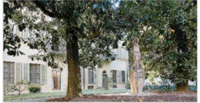
A destra, la stanza dei ritratti di Alessandro Manzoni. In alto, a destra, lo studio dello scrittore e sotto il giardino della casa con le magnifiche magnolie.